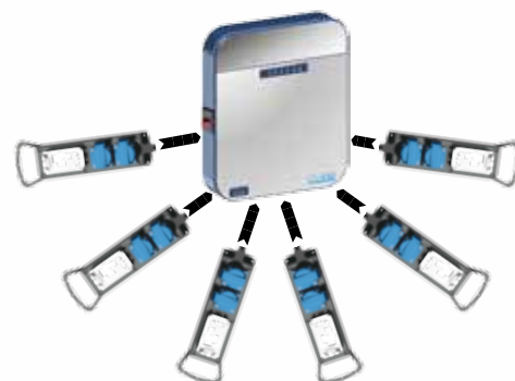
Alimentation 32A - 6 sorties mono 16A Max